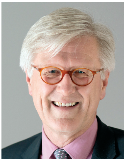
Reinhard Kardinal Marx Vorsitzender der Deutschen Bischofskonferenz